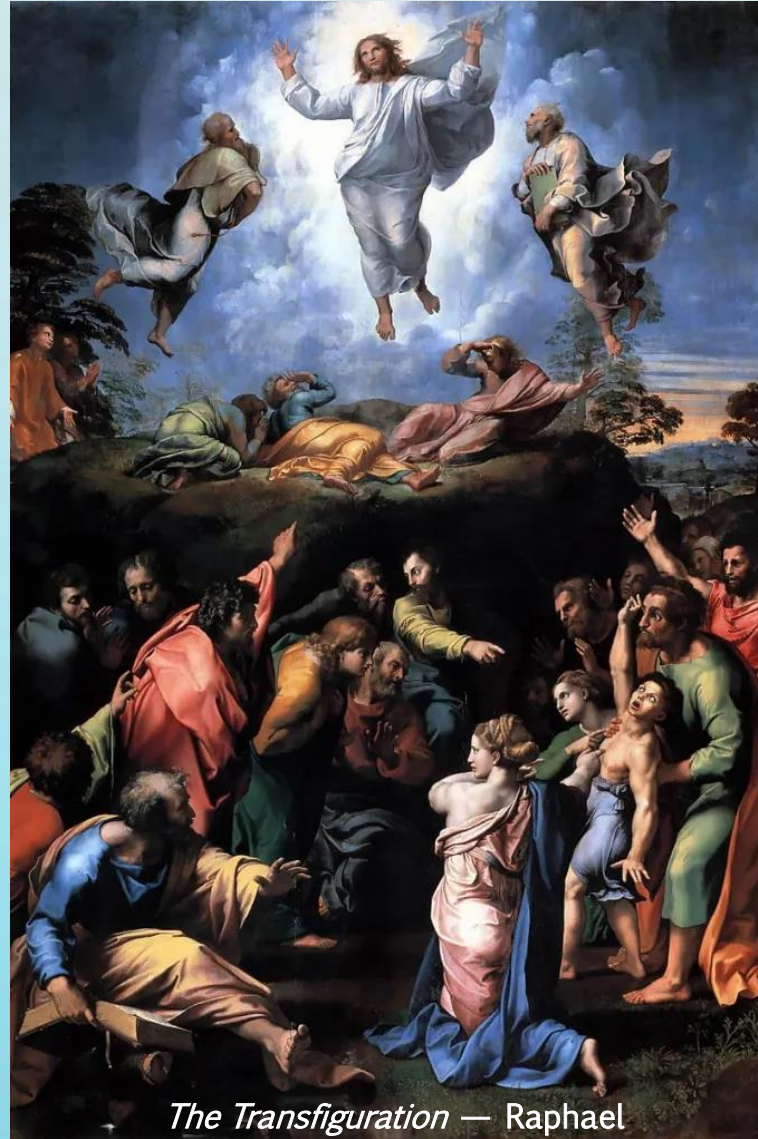
The Transfiguration — Raphael