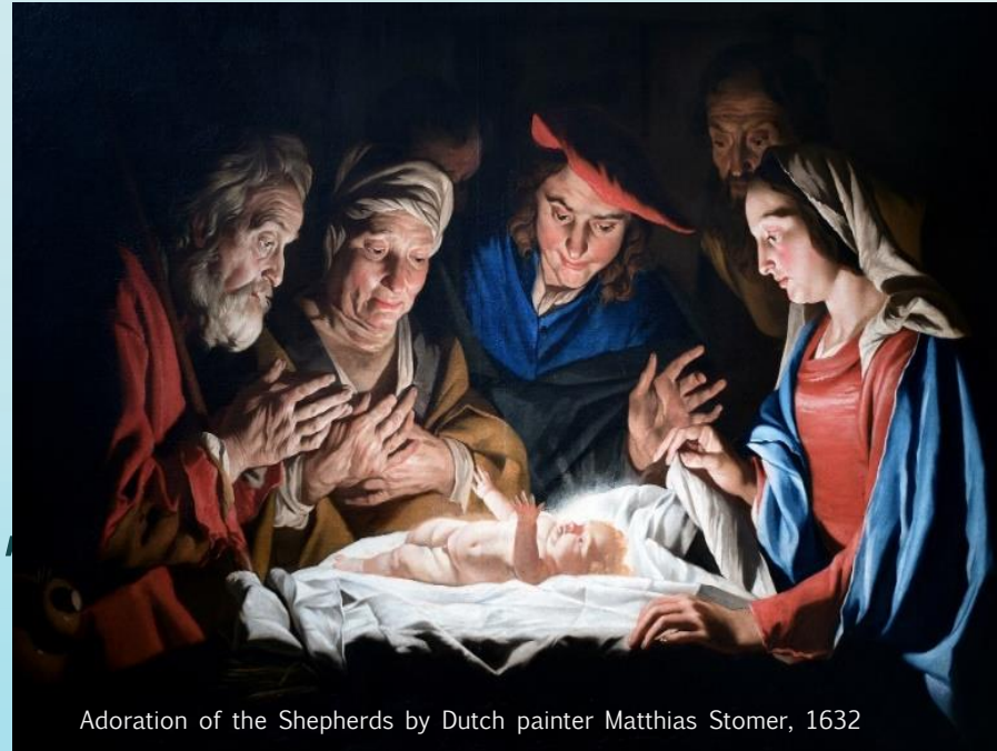
Adoration of the Shepherds by Dutch painter Matthias Stomer, 1632